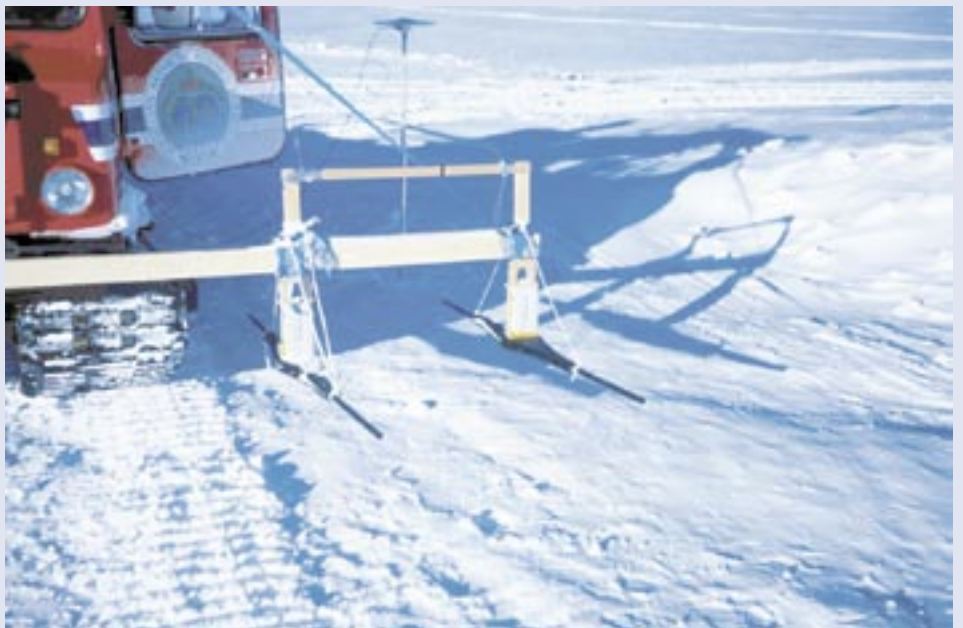
Isradarantenne montert på bandvogn