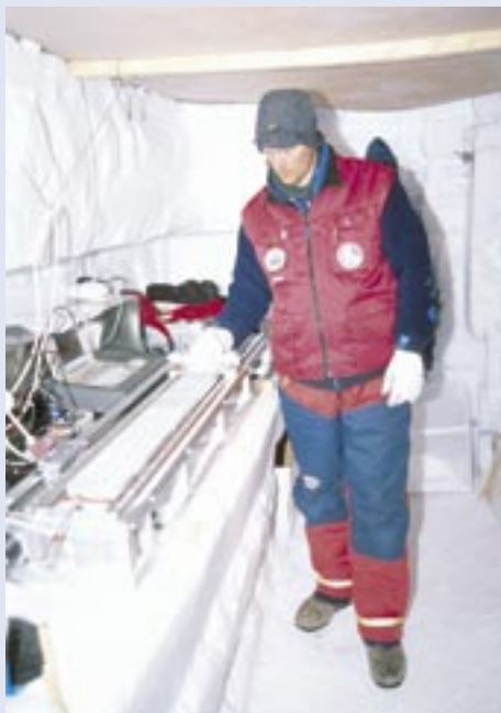
Aktivitet i snølaboratorium i Antarktis

Den store utfordringen i glasiologiske forskning i de kommende årene er å slutføre EPICA-boringen i Dronning Maud Land og tolke alle data. Det kommer også å være av interesse å utvide vår kunnskap om snøakkumulasjon for å kunne se på de dype iskjernene i en større sammenheng. Norge planlegger sammen med