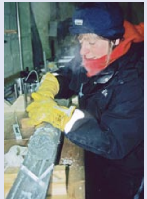
I fryselaboratorium i Antarktis