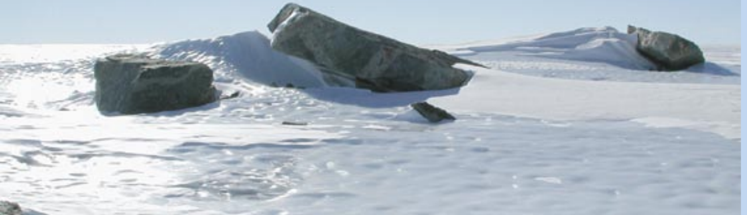
Blåis i nærheten av Troll

Antarktis domineres totalt av snø og breis, og derfor er det naturlig at glasiologi – eller studiet av snø og is – er en viktig del av forskningen i Antarktis. Norske glasiologer arbeider hovedsaklig med klimarelaterte problemstillinger: Hvordan så klimaet ut i tidligere tider? Vokser eller minsker isen i Antarktis?