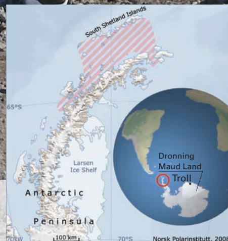
Kart: Det skraverte feltet viser hovedområdet for norske operatører.