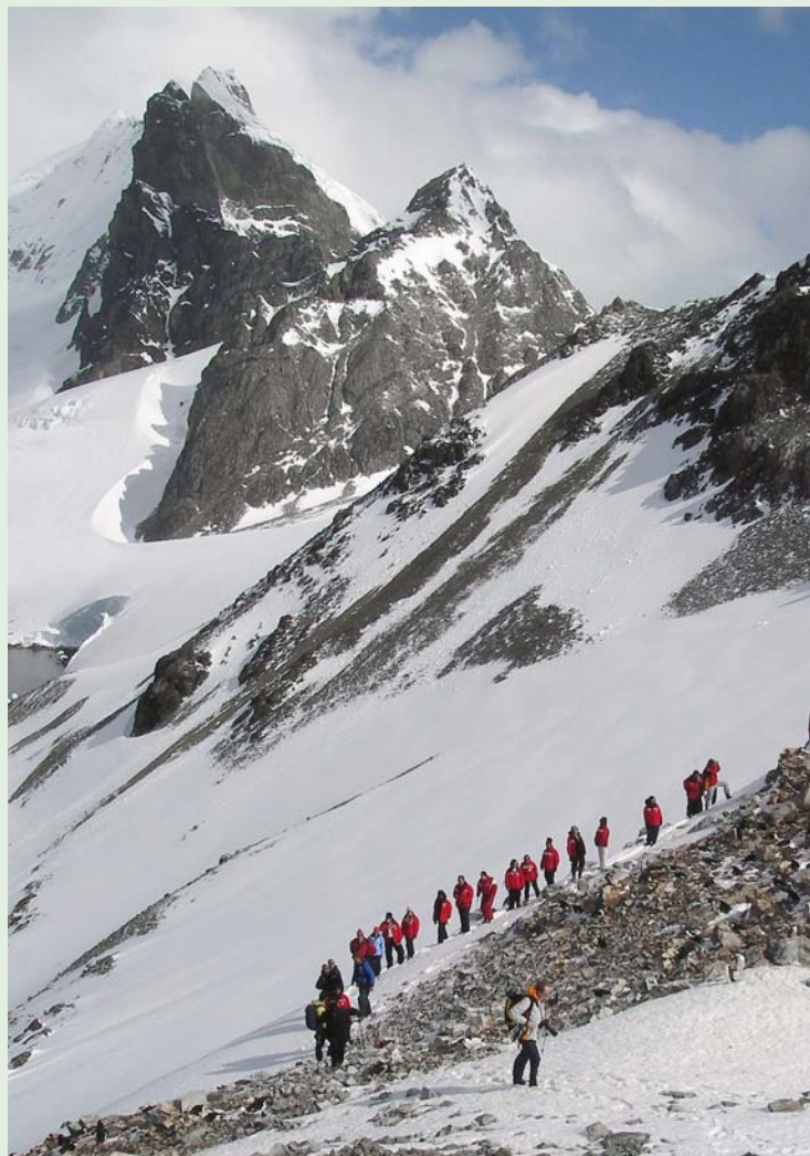
På utflykt med passasjerer fra Polar Star, Spigot Peak, Antarktishalvøya.

De siste tiårene har turismen skutt voldsom fart og er nå blitt den største menneskelige aktiviteten på kontinentet. Selv om traktaten trekker opp noen retningslinjer, har det meste av reguleringene kommet fra reiselivsnæringen selv gjennom retningslinjer utarbeidet av organisasjonen International Association of Antarctic Tour Operators (IAATO), etablert i 1991. IAATO har sterkt bidratt til å gjøre næringen miljøvennlig gjennom ulike retningslinjer.