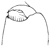
Fig. 3. Schisturella pulchra . Endes des II Gnathopoden. Nur die Beborstung der Palma und des Dactylus ist angegeben.

Shoemaker (1930, S. 13) gibt eine eingehende Beschreibung mit vielen Abbildungen, die sich fast restlos mit meinen Befunden decken, doch bildet die Hinterecke des III Epimers einen flachen aber scharfen Zahn, der ohne tiefen Sinus in den geraden Hinterrand übergeht. Außerdem ist die Palma des II Gnathopoden anders gebaut. Sie ist gleichmäßig konkav (Fig. 3), mit glattem, nur schütter beborsteten Rande. Sie nimmt die halbe Breite des Metacarpusendes ein. Die Palmarecke ist spitz und wird von 2 kleinen Stacheln flankiert. Diese Verhältnisse finden sich sowohl bei dem kleinen, wie den großen Exemplaren, stechen bei letzteren aber besonders hervor.