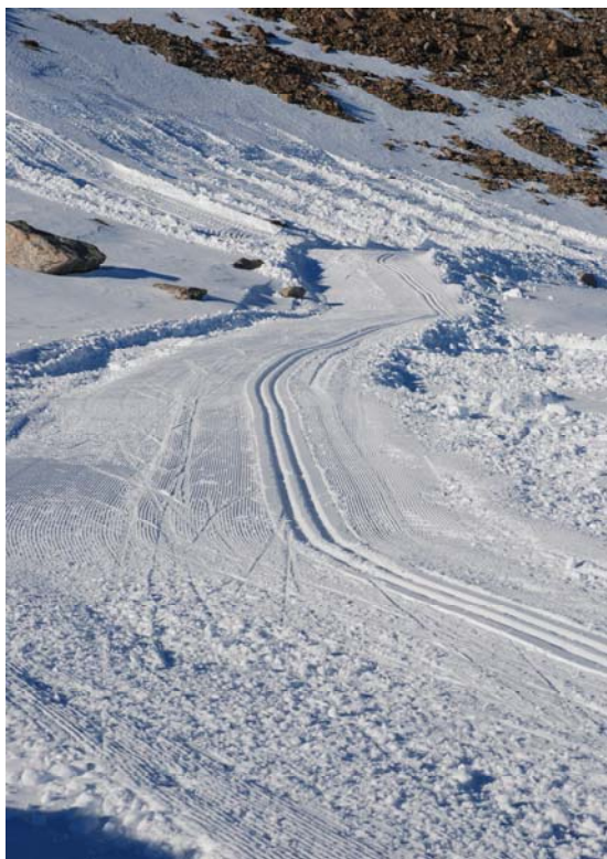
Løypa mot sør