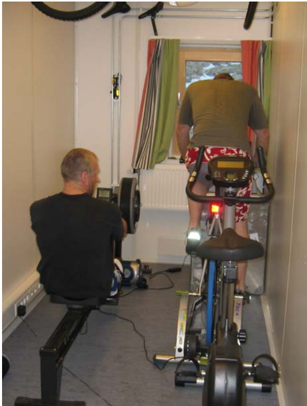
Gamle trimrom. – Reiseklart sommerpersonell til venstre

Det opprinnelige trim rommet har vi en multi-trener maskin, som ikke er så bra, men er grei nok for nedtrekk for rygg øvelser, og lette bryst øvelser. Ellers satte vi inn et stativ for mindre