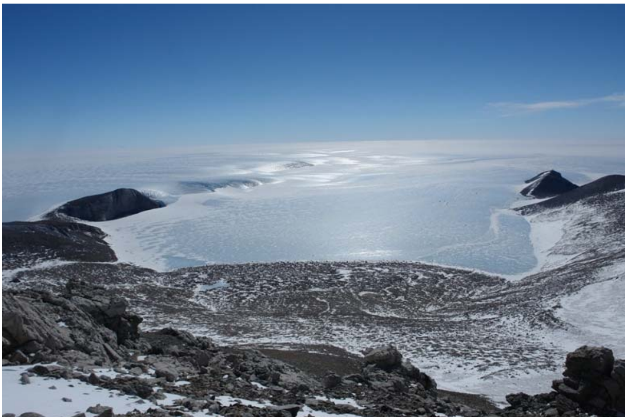
"Bukta" ved Troll, fra "Grjotlifjellet"