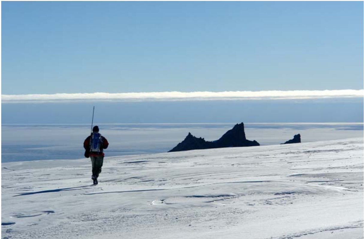
Trolltindane fra Jutulsessen