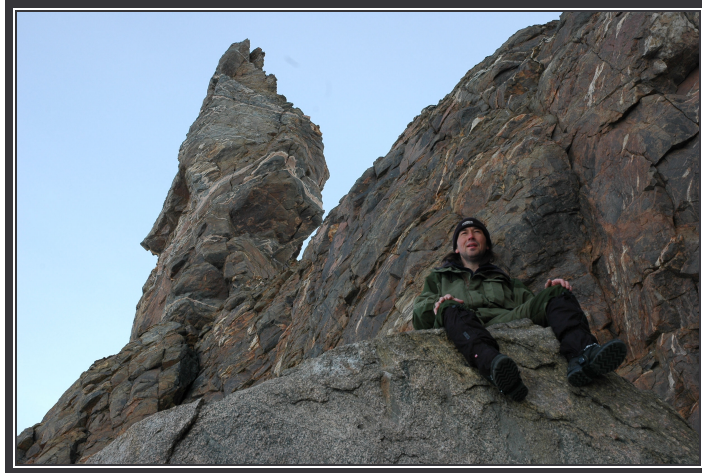
Eg blir her.