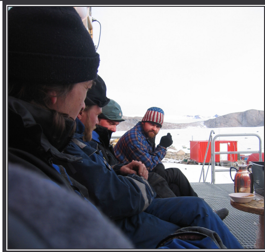
Kaffekos i solkroken.. ..