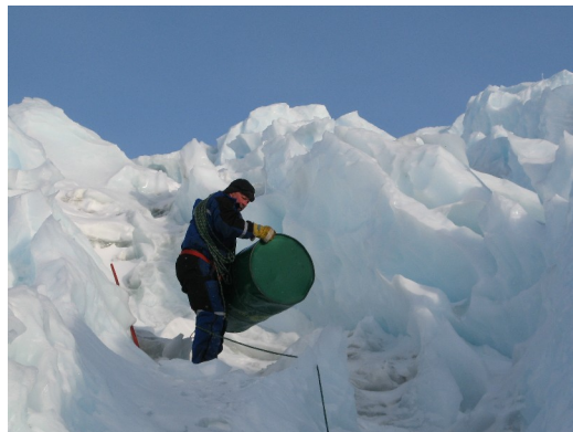
Jan har fått løs et tomfat

forsvinner alt som ikke er stropet fast. Heldigvis har vi et lite fjell ("Klovningen") og et brefall ("Førstefallet") sørvest for oss som stopper det meste som blåser vekk herfra. På en bretur i Førstefallet fant vi så mange tomfat at vi bestemte oss for å ta en opprydningsaksjon.