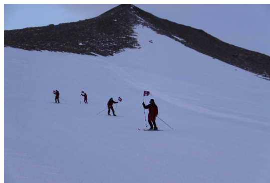
I. mai-toget på vei ned alpinbakken

Vi var alle enige at det hadde vært en vellykket 1.Mai feiring på Troll.