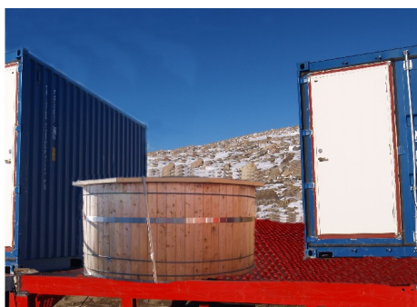
Slik var ønsket at det skulle bli