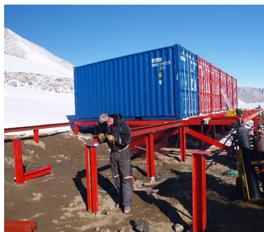
Her er fra bygging av containerrampen, der Blåmyra sør skal stå.