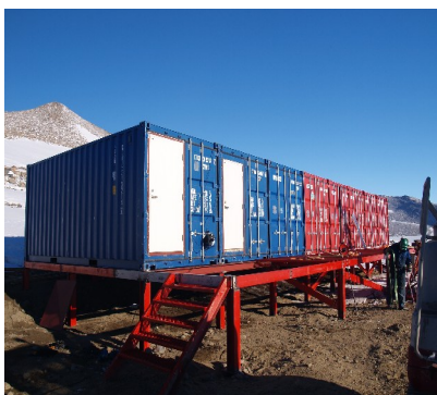
Slik ble det , Den nye Blåmyra sør