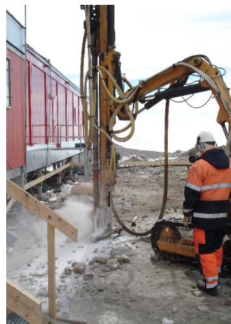
Her borer vi for fundamentet til utbygging av stasjonen

Det har vært en helt topp og trivelig sesong.