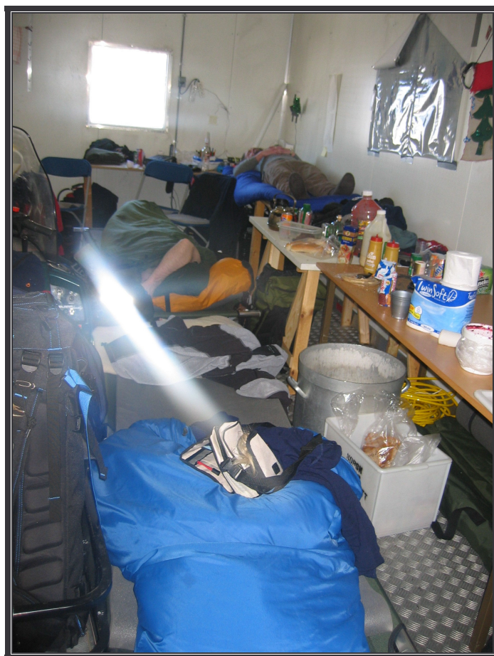
Trangt om saligheten...