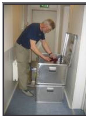
nå skal a hem.....