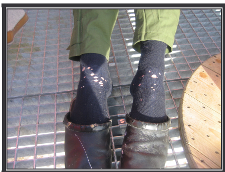
Møllene er blitt store i år.....