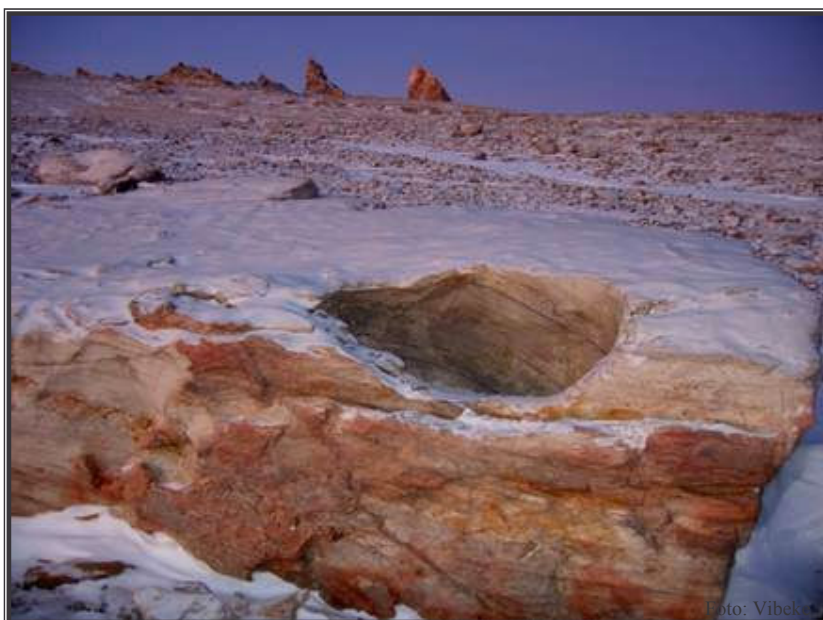
Naturlig hvilebenk på tur opp til Sofietoppen.