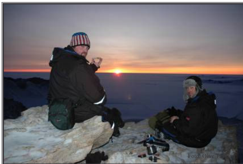
Maten smaker bedre i friluft..