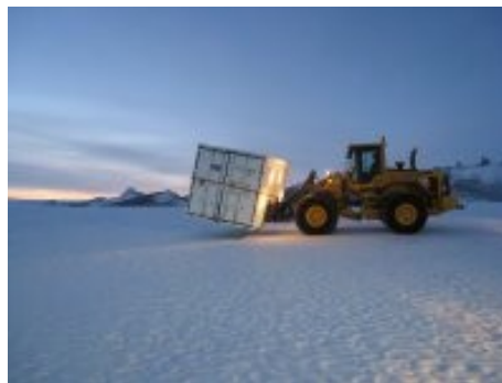
Henting av containere på isen