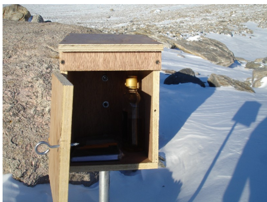
Trimkassa i Grjotlia

Jeg håper at alle fortsatt vil gå mye på ski, å at vi kan benytte skiløypene våre helt til vi reiser herifra i desember.