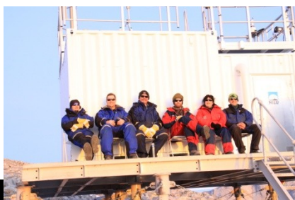
Her er vi på Nilubua, og vi har spist solbolle og det er første dag med solbriller, i år.

1. august kom, og ingen sol, og solbollene ble på frysa, fram til mandag 3. august.