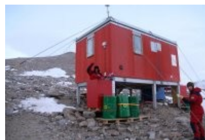
Talarstolen med fat og strammeband er søkk borte