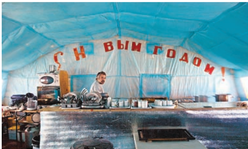
KJØLIGSTEMNING. It's not terrible conditions in Antarctica, but it's not good. Restaurant på den russiske Novolazarvskaya basen i Antarktis.

Taket i flyet så ut som det var sydd sammen av istykkerrevne fallskjerm, maskinisten sov under i en gammel avis, navigatøren hadde koblet seg fra instrumentbordet og styrte oss ut til det siste kontinent med en håndholdt gps, en time etter take off ble det servert en flaske vann slik passasjerene skulle føle de fikk valuta for de 80.000 kronene flybilletten kostet. Noen hadde fortalt at hele flyturen kostet 3,5 millioner kroner, de som betalte denne prisen var aspirerende helter fra polarnasjoner som Japan, Russland, Norge og In-