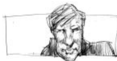
Syv prosent av befolkningen lider av flau blære PER A. RISNES JR.

På den andre siden, det kan som sagt være vi har det for bra.