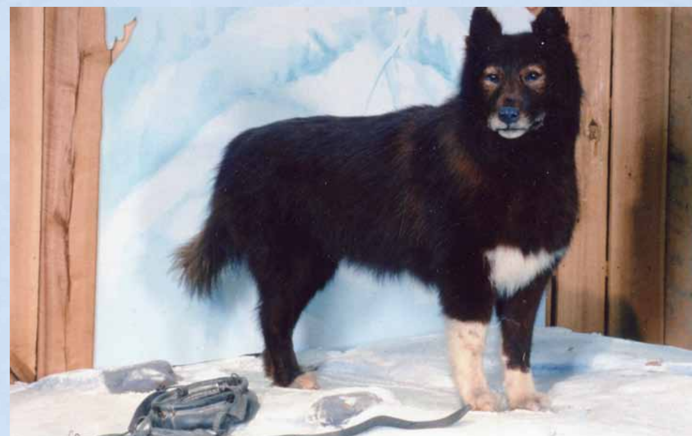
Balto står utstoppet på Cleveland Museum.