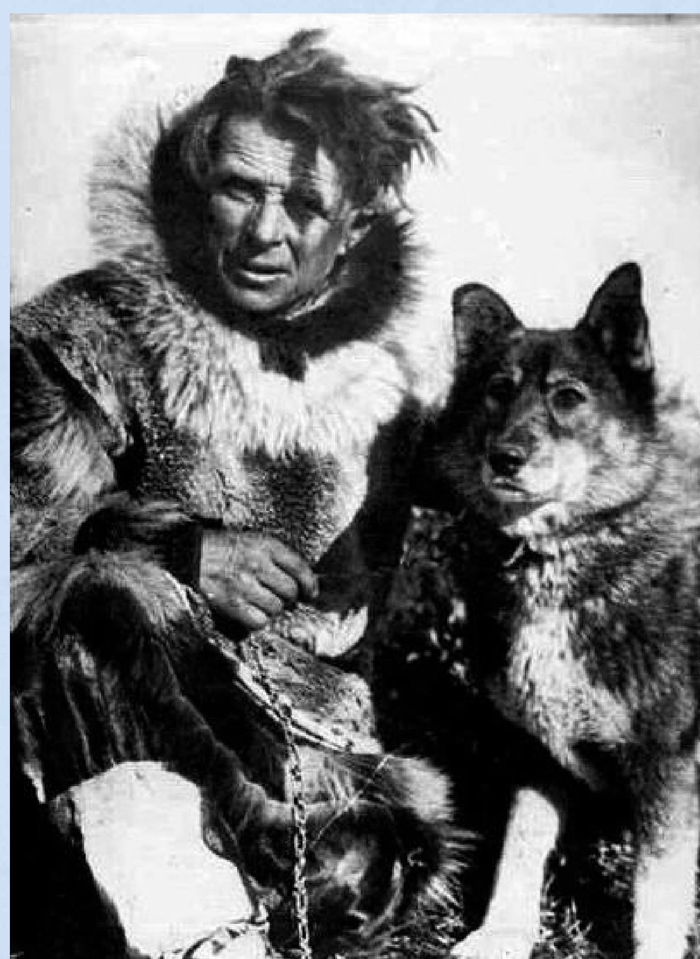
Leonhard Seppala og Togo.

I 1995 kom en tegnefilm som var løselig basert på historien om Balto, noe som gjorde historien om serumløpet kjent for nye generasjoner. I desember 2011 lanserte NRK dokumentarfilmen «Balto - helten fra Alaska.»