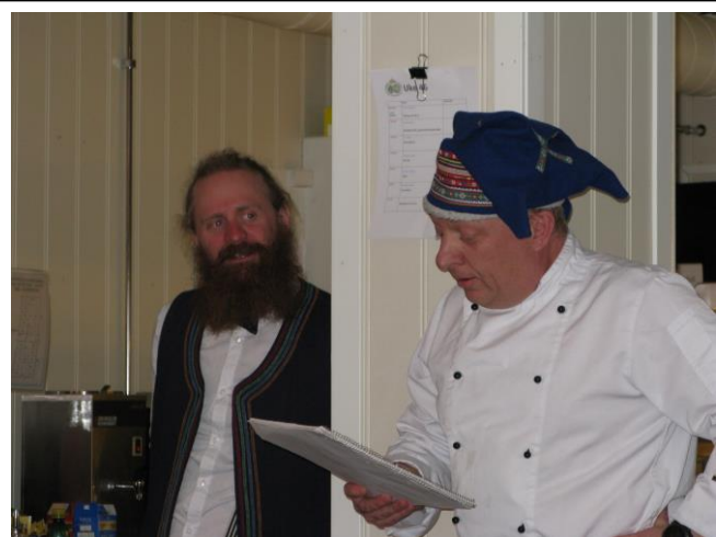
Kokken Rune holder tale

Det ble holdt en flott overtagelsesmiddag for OVT den 15. november. Maten var nydelig tilberedt av avtroppende team og menyen besto av kamskjell, hjemmelagete viltpølser og creme brulet. Vi var til sammen 30 personer tilstede og det ble holdt taler fra både gamle og nye OVT, samt fra K-sat og Norsk Polarinstitutt. I tillegg ble det underskrevet en overtagelsesprotokoll der det fremkom at det i overlappingsperioden ble lagt vekt på den faglige stillings innhold og gjøremål, samt på felles rutiner for drift av stasjonen og erfaringer fra avtroppende OVT. Påtroppende overvintringsteam anså overlappingen for tilfredsstillende og var dermed klare for å overta drift av stasjonen. Protokollen var grundig stemplet og ble underskrevet av samtlige medlemmer i både gamle og nye overvintringsteam.