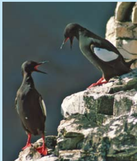
Teist er høyt prioritert for sirkumpolar overvåking av miljøgifter.