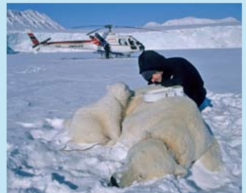
Vi kan nå målene for overvåkingen raskere og billigere dersom det brukes standardiserte metoder.

Denne typen analyser er et eksempel på hvordan man kan gå fram for å få mindre naturlig varians i prøvematerialet og mer realistiske forventninger til hva overvåkingen kan levere av trendanalyser. Slike statistiske analyser bør inngå i all overvåking. Det trengs imidlertid også mer forskningsinnsats for å bedre overvåkingsmetodene.