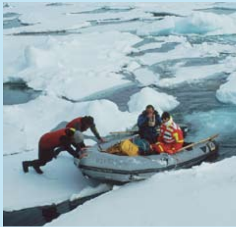
Innsamling av prøver i isen.

til hovedtransportrutene inn og ut av Barentshavet. Det bør tas prøver i vann, sedimenter og is, helst også av utvekslingen med atmosfæren. Prøvetakingen bør omfatte standard fysiske parametre. Kjemiske stoffer må vurderes både i forhold til hva det er realistisk å måle i de ulike mediene (måling av organiske miljøgifter i sjøvann er særlig komplisert) og hvilke stoffer som er ønskelige å studere i levende organismer.