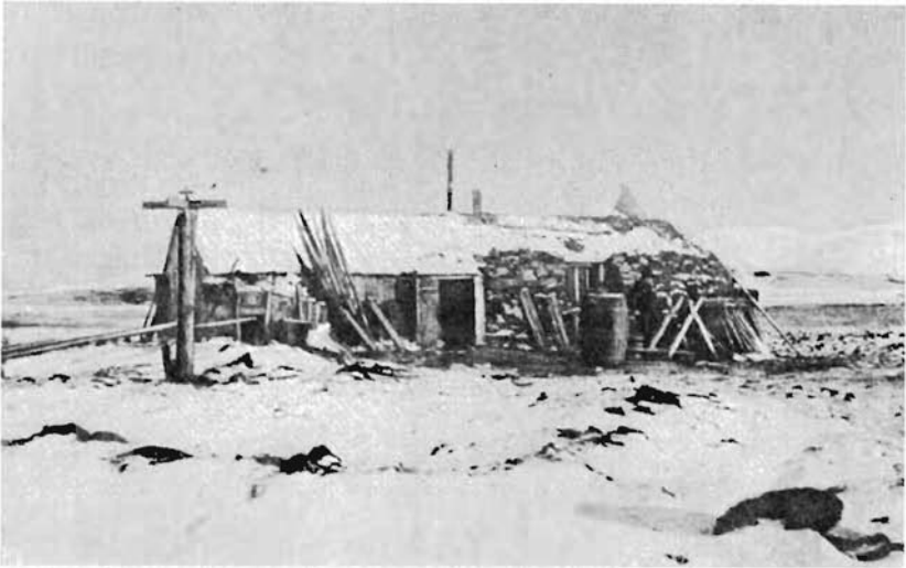
HAGERUPS hytte på Akseløya. (Etter BIRKELAND 1908.) Første del av denne ble bygd i 1898.

Captain HAGERUP's house at Akseløya. The first section was built in 1898.