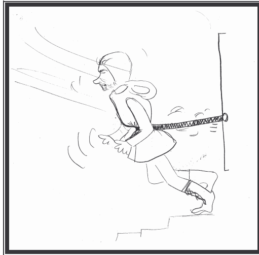
Breakdance ved aggregathuset

Det er ikke let at være aggregatvakt i full storm og mørke og når man ikke skjønner at ens belte henger fast i den lukket dør til aggregathuset----- og man bare gir mer og mer gas for at komme seg hjem-----!