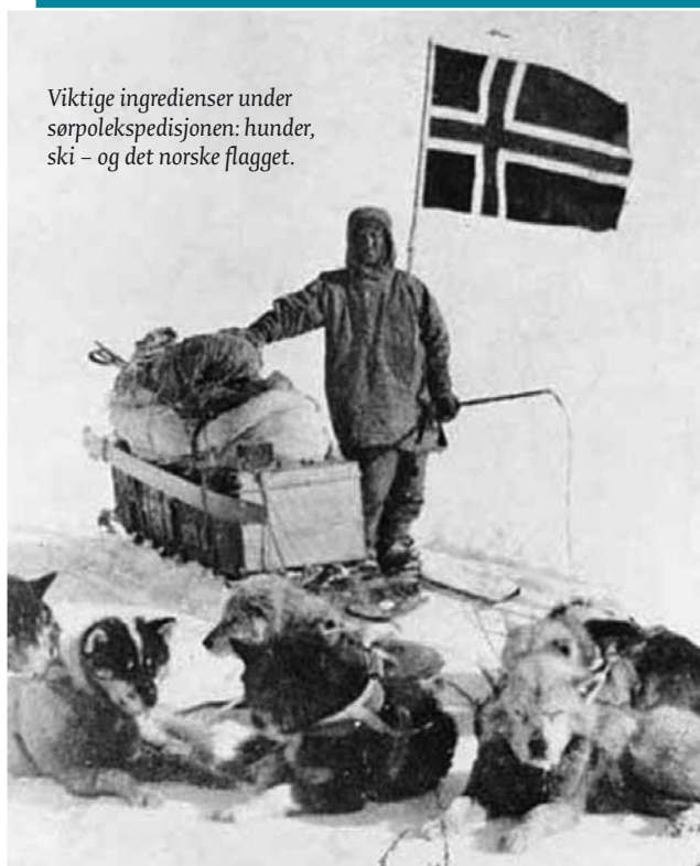
Viktige ingredienser under sørpolekspedisjonen: hunder, ski – og det norske flagget.

Det var en makt som ifølge Nansen gikk som en rød tråd gjennom polarforskningens historie. Amundsen bidro til å føre den videre.