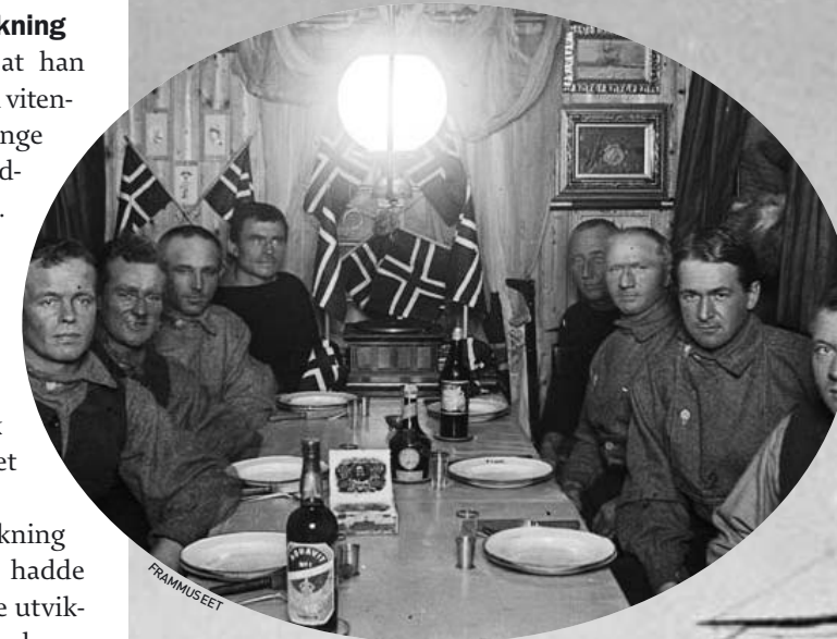
Under ekspedisjonen til Sørpolen etablerte Amundsen og hans menn en base som ble døpt Framheim. Her er karene i feststemning på basen.