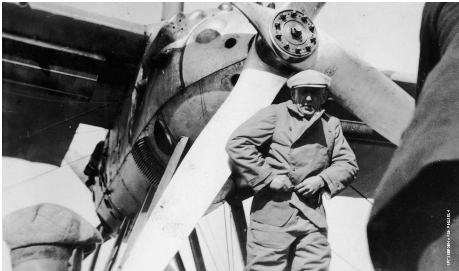
Tromsø, 18. juni 1928. Roald Amundsen gjør seg klar for den skjebnesvangre flyturen som skal bli hans siste.

kjempet mot skruisen, skrev avisene side opp og side ned om hva som kunne ha skjedd. Mange begynte å miste håpet. 15. juni hadde de klart å fottrække en rullebane på ca. 500 meter. Det var akkurat nok.