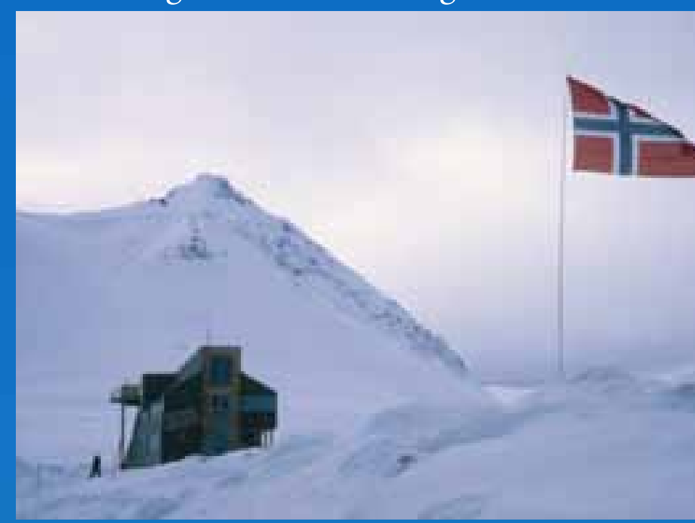
Sverdrupstasjonen er Norsk Polarinstituttts forskningsstasjon i Ny-Ålesund.

Stasjonens faste stab av ingeniører og teknikere vedlikeholder og leser av instrumenter som kontinuerlig tar inn strålings-, luftforurensnings-, ozon-, seismikk- og andre data av verdi for forståelse av polarområdene, - på oppdrag av Polarinstituttets egne forskere og andre. Også land som ikke er representert i Ny-Ålesund har forsknings- og overvåkningsprosjekter ved stasjonen i samarbeid med Norsk Polarinstitutt. Tjenestene ved Sverdrupstasjonen omfatter dessuten forskningservice som utleie av kontorplass, bekledning, overlevelsedrakter, snøscootere og gummibåter.