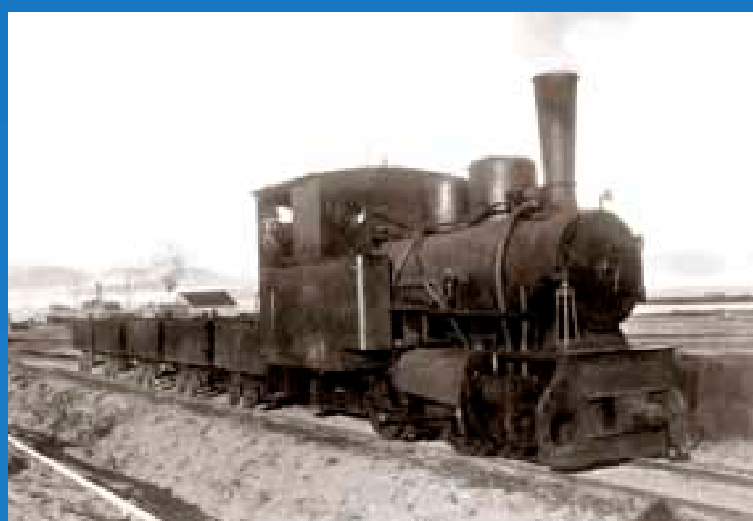
Lokomotivet sørget for å frakte kull fra gruvene til kaia for lasting ombord i ventende skip.

Forskerlandsbyen Ny-Ålesund er den nordligste permanente landstasjon i verden. Kings Bay A/S har ansvaret for infrastrukturen på stedet, og forskning, miljøovervåking og turisme i begrenset omfang er stedets eneste virksomheter. For Norge er det viktig at internasjonal forskningsetablering på Svalbard skjer slik at norsk infrastruktur utnyttes og at vi er til stede med en tung og synlig egenforskning.