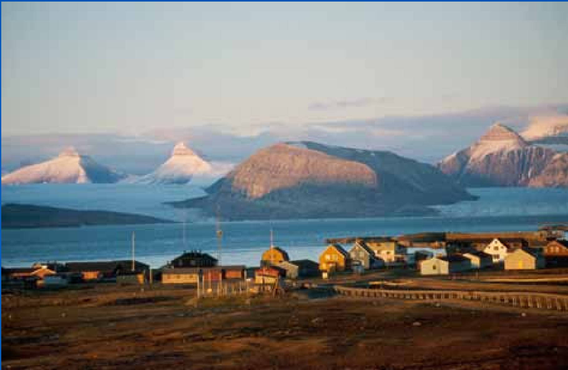
Ny-Ålesund badet i kveldslys.