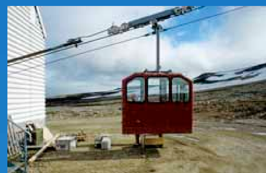
Fjellheisen frakter folk opp til Zeppelinstasjonen.

Zeppelinstasjonen for atmosfærisk overvåking og forskning ligger 474 m.o.h. på Zeppelifjellet ved Ny-Ålesund. Stasjonen ble åpnet i 1990 og gjenåpnet etter utbygging av Kronprins Haakon Magnus i 2000. Med minimal lokal forurensning er den svært godt egnet for overvåking av atmosfæren, inkludert spredning av radioaktiv forurensning og miljøgifter, uttynning av ozonlaget og klimaendringer. Norsk Polarinstitutt driver stasjonen og Norsk institutt for luftforskning (NILU) har stor aktivitet der. Zeppelinstasjonen inngår i flere regionale, nasjonale og globale overvåkningsnettverk.