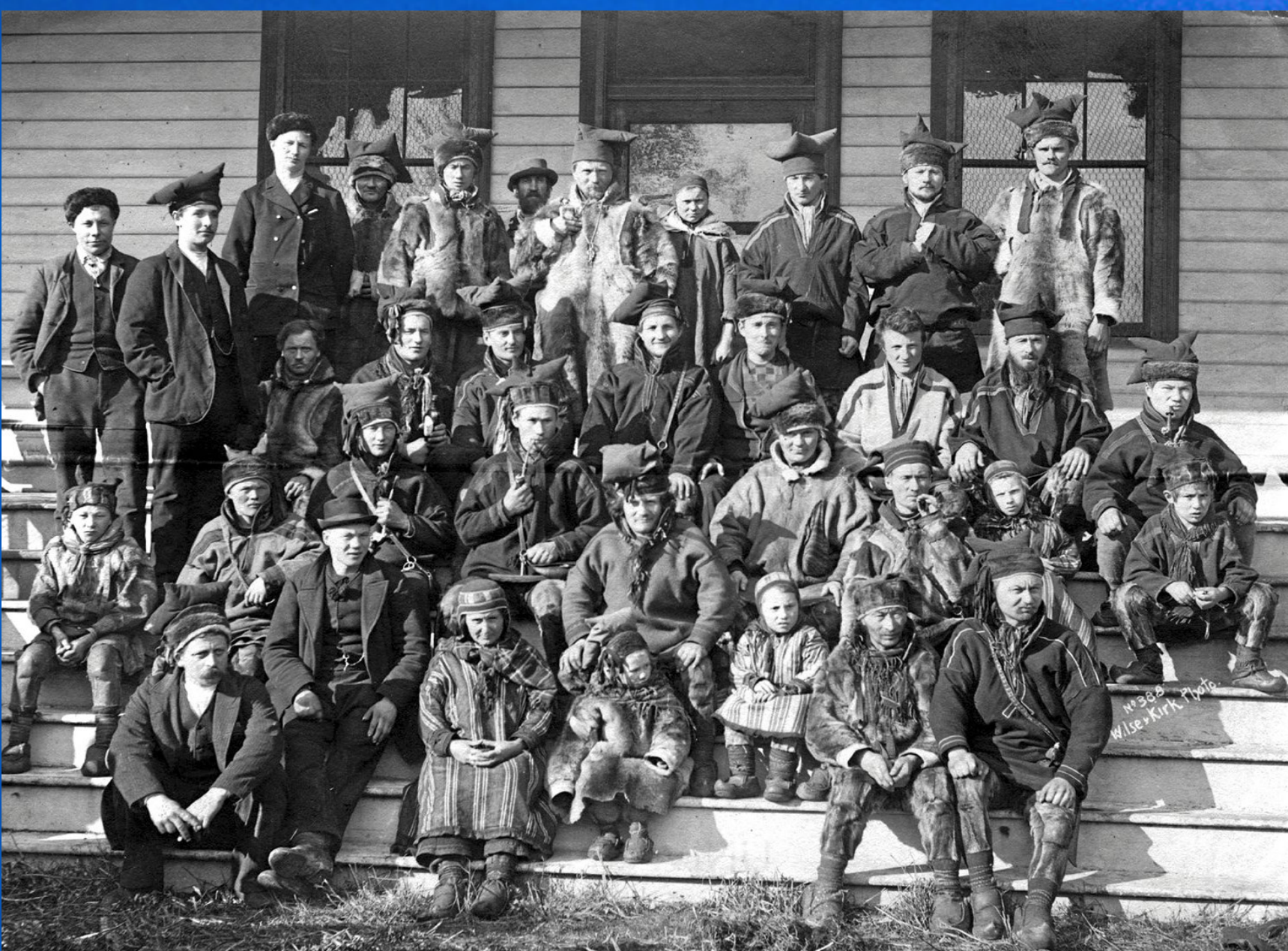
113 menn, kvinner og barn dro til Alaska i 1898 for å lære inuittene tamreindrift.

Inuittene i Alaska hadde på slutten av 1800-tallet mistet sitt levebrød, da sel, hval og hvalross nærmest var utryddet. Pastor Sheldon Jackson reiste på den tida i Alaska for å misjonere, og her møtte han sult og elendighet blant de innfødte. Før han kunne misjonere, måtte befolkninga i området få mat og noe å leve av. Jackson så over til russisk side hvor folk levde av tamreindrift, og fant ut at det måtte være løsninga for Alaskas urfolk. Han fikk over rein og reinpassere fra Tsjuktsjerhalvøya for å prøve ut tamreindrift i Alaska. Det ble ingen suksess, og Jackson begynte å se mot samene i Skandinavia som også drev tamreindrift og i tillegg var kristne. I 1894 ble et prøveprosjekt gjennomført hvor seks samefamilier fra Finnmark kom til Alaska for å prøve reindrift.