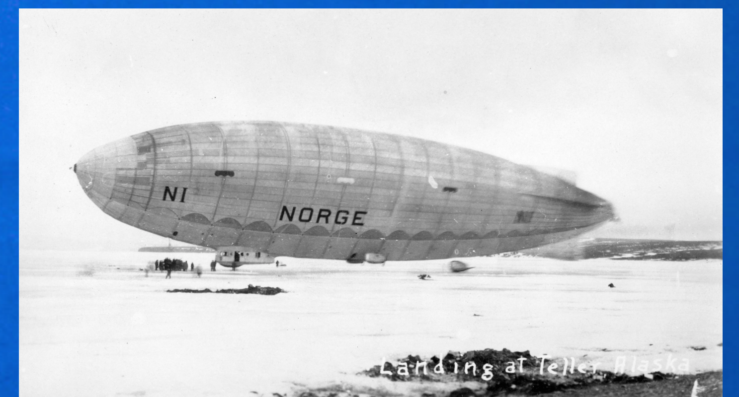
Luftskipet Norge lander i Teller i Alaska 1926.