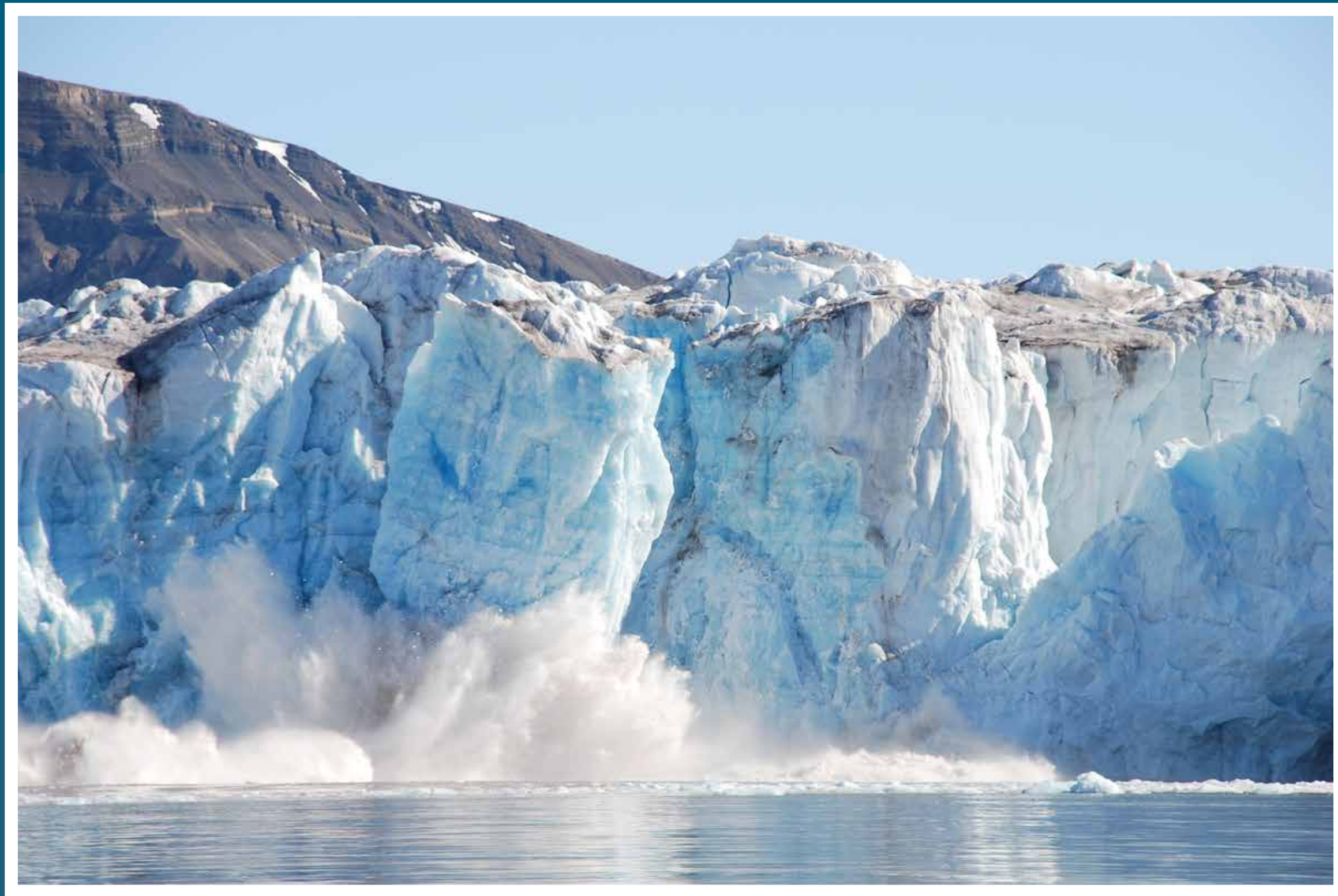
Kronebreen på Svalbard kalver i havet.

Havet vil fortsette å stige i århundrer. Hvor mye, er i stor grad avhengig av våre utslipp.