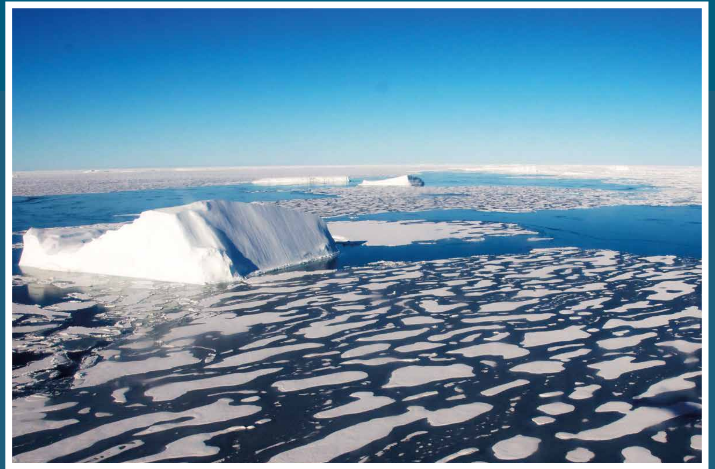
Havet blir varmere.