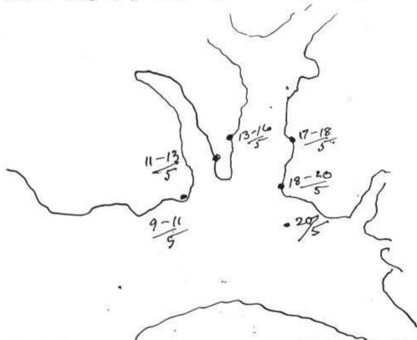
Skisse av vår rute i denne fjord.

Hundene har ondt for å gå frem og selvfølgelig enda verre for å trekke. Vi hadde igår opgitt håpet om å komme videre med de lass vi har, og vi hadde talt om hvad vi skulde forlate. Vi vilde legge igjen så meget at vi bare fikk et lass og så ha begge kobbeler for det. Da skulde det gå. Imidlertid vilde vi idag gjøre et forsøk, og det synes som om vi skal greie det uten å kaste noe. Været står nu i eftermiddag og vet ikke hvad. Blir det godvær, eller blir det det samme igjen? ÷ 10,6, stille og delvis overtrukket med lettere skyer, men tykk i syd og øst. Vinden sydøstlig