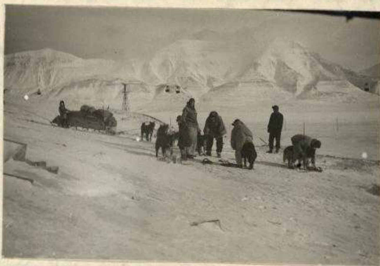
Hundene spendes for