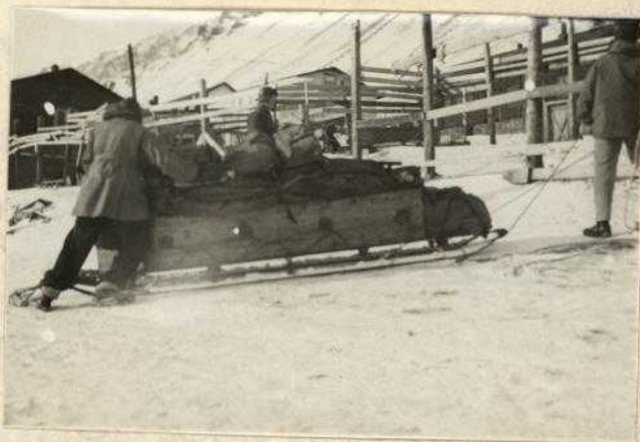
Bagagen surres på sleden

Funksjonærer ved Store Norske Spitsbergen Kulkompani drar på påsketur til Sveagruben.