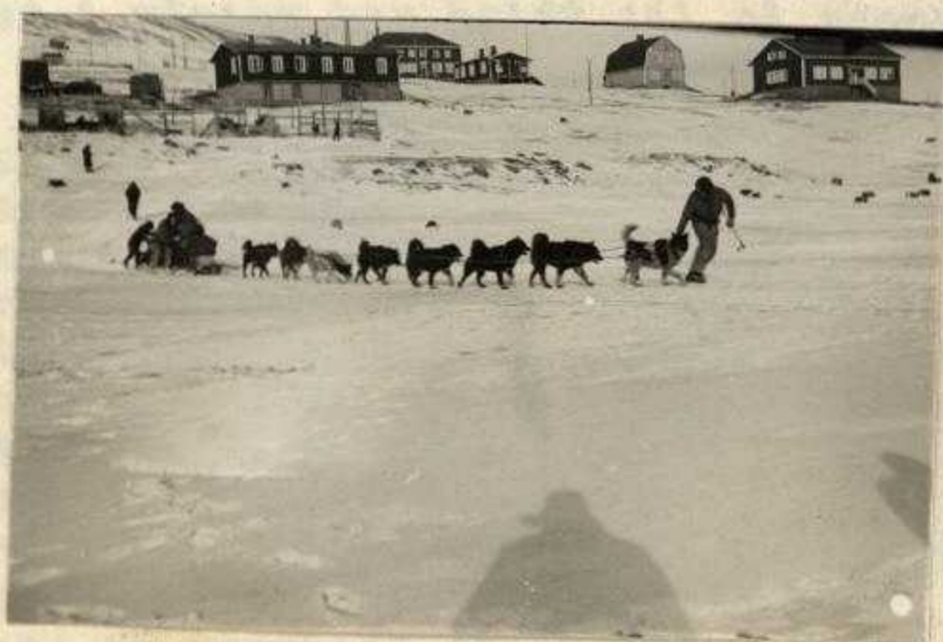
Starten. Marsj op.