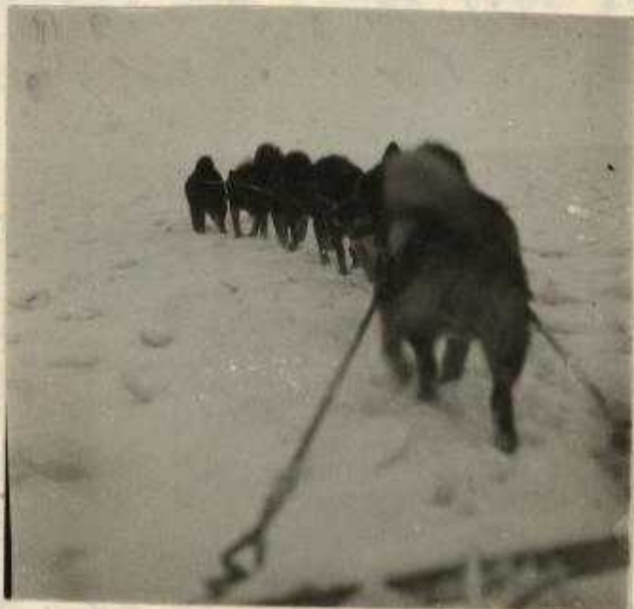
Høi til moskusdyrene kjøres med hundespenn over isen til Hiorthhavn. Fotografert fra høilasset.