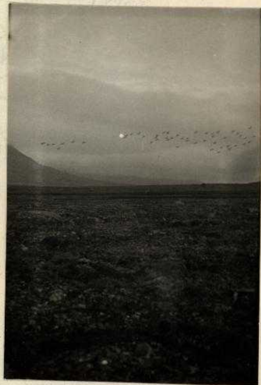
Grågås. Utsikt nedover mot Reindalen.